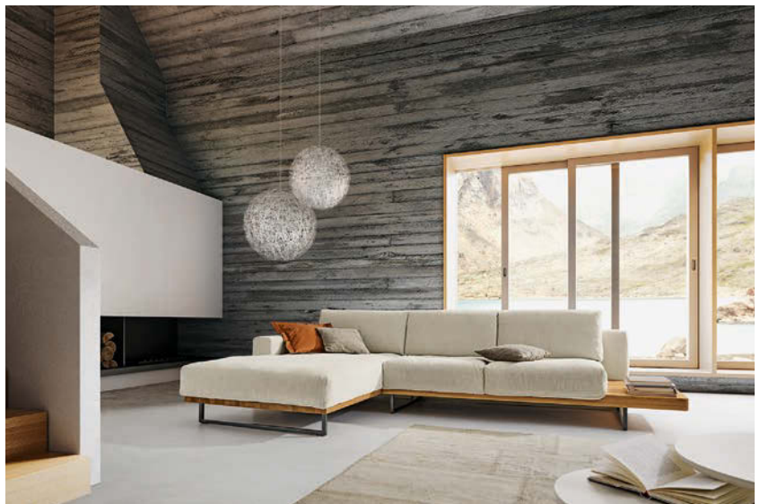
SITZGRUPPE HELSINKI vereint edles Massivholz mit einer weichen Polsterung.

Mit Massivholz zelebriert man die eigene natürliche Wohnkultur. Heute legen Menschen großen Wert auf