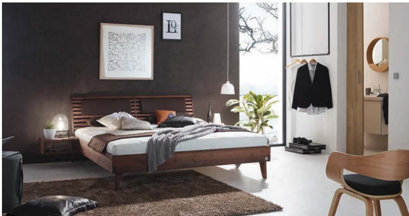
MASSIVHOLZBETT Legno Nobile sorgt für ein angenehmes Raumklima.

Holz lebt und atmet – deshalb wohnen wir so gerne mit ihm zusammen. Auch im Schlafzimmer spielt das Naturprodukt seine positiven Eigenschaften aus. Holz ist atmungsaktiv, nimmt Wärme und Feuchtigkeit auf und reguliert optimal das Raumklima. So sorgen die Betten der Terra-Kollektion mit ihren massiven Sichtholzelementen für ein besonders angenehmes Schlafklima. ●