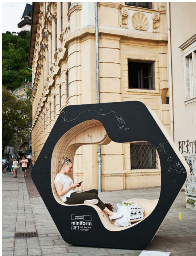
Modulares Stadtmöbel von Hohensinn Architektur & Miniform, realisiert durch die Fritz Friedrich GmbH.

„Unsere hervorragende stärkefeldübergreifende Zusammenarbeit sorgt für steirische Erfolgsgeschichten mit Signalwirkung! Holz im Fahrzeug, unsere smarten Stadtmöbel aus Holz sowie zahlreiche interdisziplinäre Qualifizierungsmaßnahmen sind Leuchtturmprojekte, die letztlich der gesamten Holzwirtschaft Flügel verleihen.“