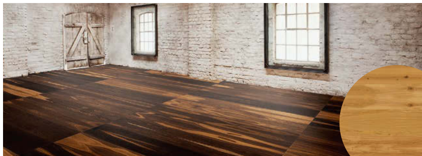
KUNSTVOLL. TwinART ist das neueste Produkt von Weitzer Parkett.