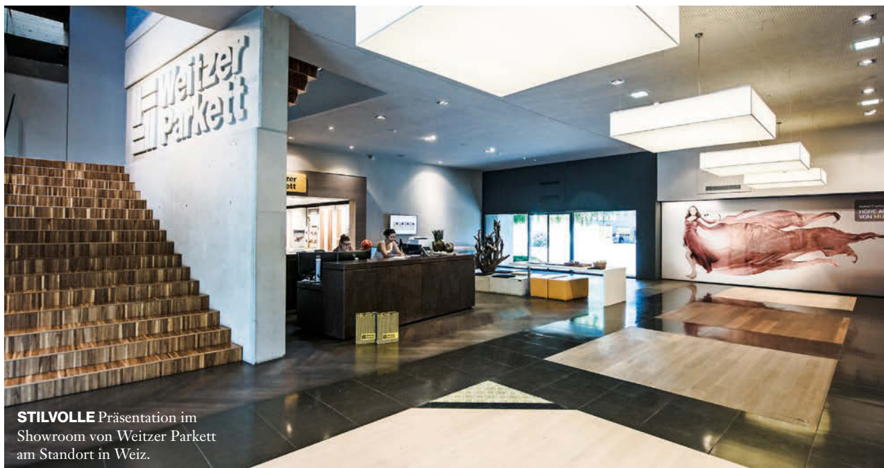
STILVOLLE Präsentation im Showroom von Weitzer Parkett am Standort in Weiz.